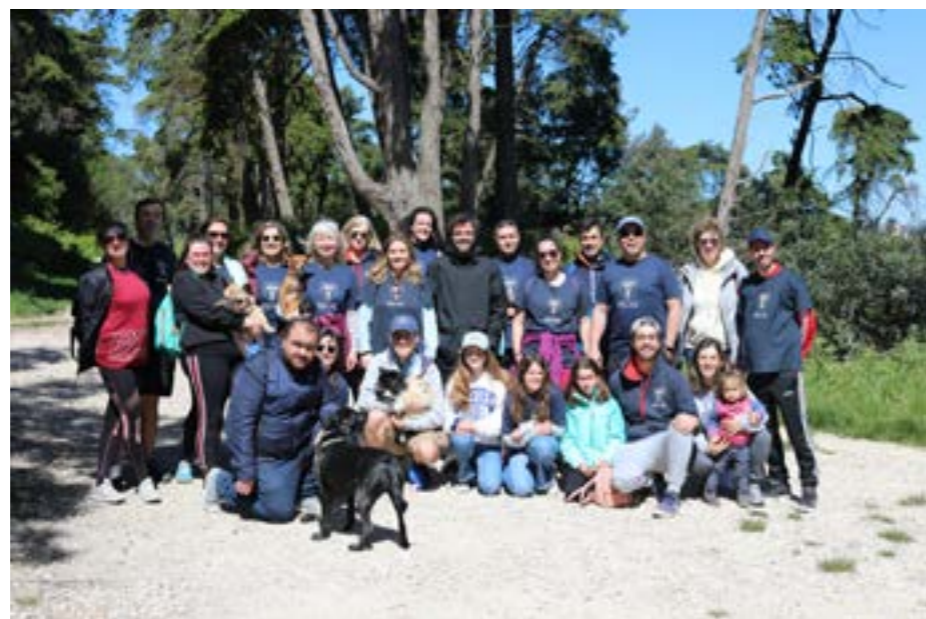
Participação de 30 elementos entre Iscalinos, familiares e amigos de 4 patas.